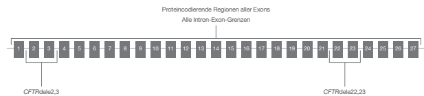
Abbildung 3: Mit dem TruSight Cystic Fibrosis Clinical Sequencing Assay sequenzierte CFTR-Regionen: Die mit dem Assay sequenzierten CFTR-Regionen umfassen proteincodierende Regionen aller Exons, Intron-Exon-Grenzen, ca. 100 nt flankierender Sequenz um die 5'- und 3'-UTRs, zwei tiefe intronische Mutationen (1811+1.6kbA>G, 3489+10kbC>T), zwei große Deletionen (CFTRdele2,3, CFTRdele22,23) und die PolyTG/PolyT-Region.

Bibliotheksvorbereitungskits zur Verarbeitung von 24 Proben pro Lauf oder die einmalige Verwendung zur Verarbeitung von 96 Proben in einem Lauf. Zusätzliche Flexibilität wird durch zwei Sequenzierungs-Kit-Konfigurationen ermöglicht: das MiSeqDx v3 Kit in der Standardversion (24–96 Proben pro Fließzelle) und das im Preis günstigere MiSeqDx v3 Micro Kit (24–36 Proben pro Fließzelle). Sämtliche Reagenzien werden gebrauchsfertig geliefert, was den manuellen Aufwand verringert und die Einheitlichkeit zwischen einzelnen Tests erhöht.