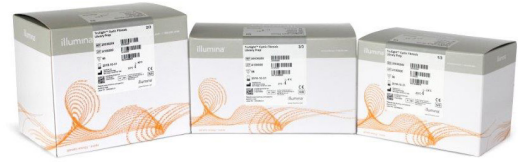
Abbildung 1: TruSight Cystic Fibrosis: TruSight Cystic Fibrosis vereint vorhandene Assays in einem einzigen Kit und erhöht damit die Vielseitigkeit und den Probendurchsatz.

TruSight Cystic Fibrosis vereint den MiSeqDx Cystic Fibrosis 139-Variant Assay und den MiSeqDx Cystic Fibrosis Clinical Sequencing Assay in einem einzigen Kit und erhöht damit die Vielseitigkeit und den Probendurchsatz. Erreicht wird dies mithilfe aktualisierter Sequenzierungsreagenzien, während der Workflow, die Spezifikationen und die Leistung im Vergleich zu den ursprünglichen Assays unverändert bleiben. Im Rahmen der Integration in TruSight Cystic Fibrosis wurden die Namen der Assays in TruSight Cystic Fibrosis 139-Variant Assay und TruSight Cystic Fibrosis Clinical Sequencing Assay geändert.